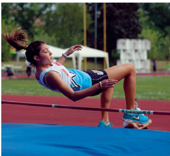
Fmi Parma Sprint Più di quattrocento ragazzi si sono sfidati ieri pomeriggio al Lauro Grossi.